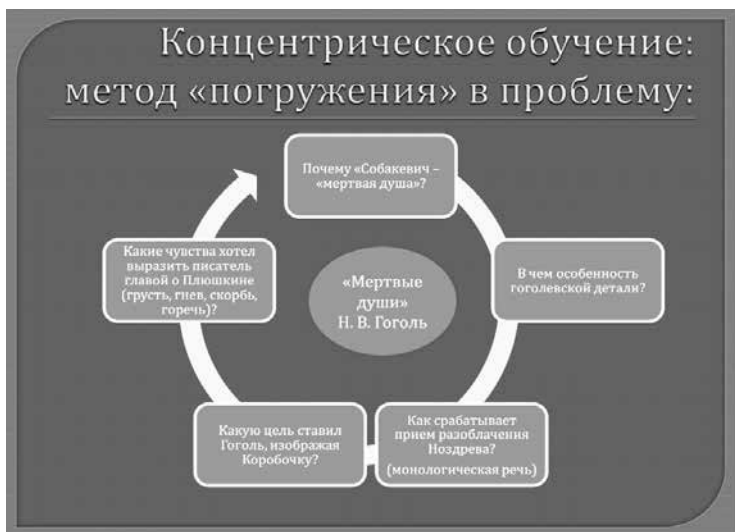
Рисунок 3. Технологическая модель № 3