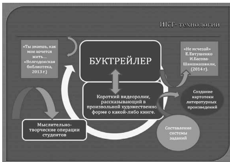
Рисунок 5. Технологическая модель № 5

Актуальной проблемой преподавания литературы в аудитории высшего образовательного учреждения становится проблема организации текстовых действий в процессе анализа текста.