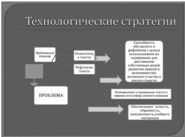
Рисунок 2. Технологическая модель № 2