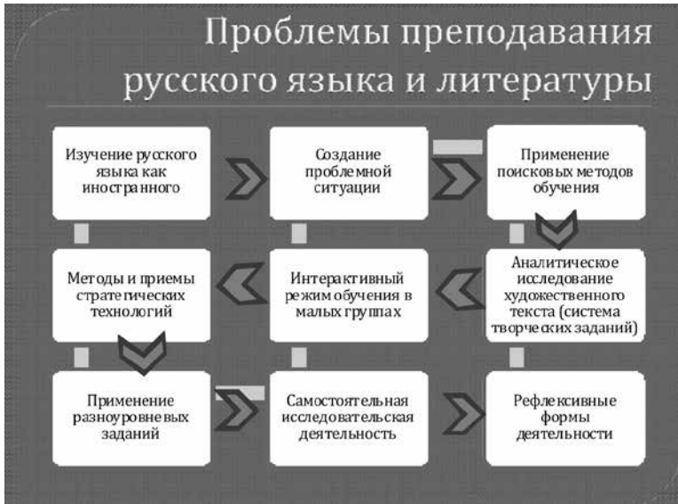
Рисунок 1. Технологическая модель № 1