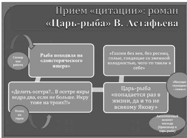
Рисунок 4. Технологическая модель № 4